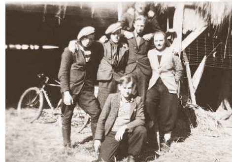
21.04.1944, Morgens, nach einer Scheunenübernachtung Après avoir passé la nuit dans une grange