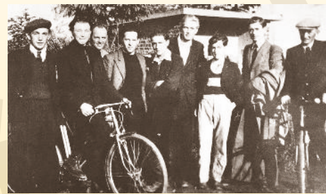
12.06.1944, auf dem Bahnhof Limerlé, Fluchthelfer mit alliierten Fliegern En gare de Limerlé: les passeurs avec des aviateurs sauvés