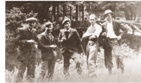
13.06.1944, in Belgien: drei Fluchthelfer und zwei Flüchtlinge Trois passeurs et deux réfugiés en Belgique